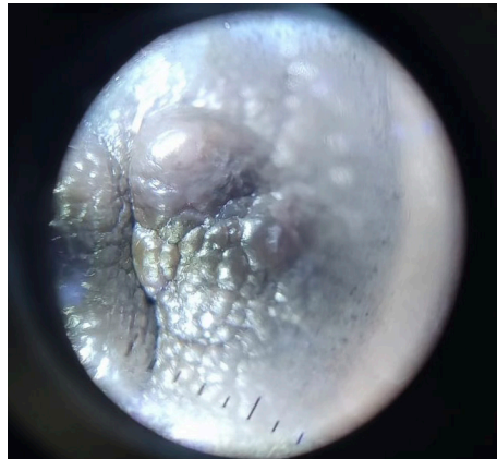
Figura 2. Imagen dermatoscópica con cuerpos globulares