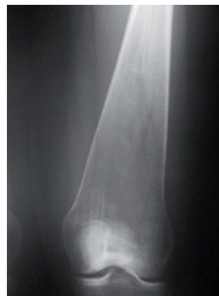
Figura 2. Deformidad en región distal del fémur en forma de matriz de Erlenmeyer.

A pesar de constituir la enfermedad de depósito lisosomal más frecuente en el niño, en la actualidad aún existe cierto grado de controversia respecto de su abordaje clínico. En lo referente a su tratamiento, hemos de destacar cómo la terapia mediante sustitución enzimática ha supuesto un importante avance en la corrección de la alteración metabólica que la origina. Del mismo modo, otros procedimientos como la administración de plasma no fraccionado o de leucocitos, inyecciones de enzima purificada, placenta o bazo, así como la implantación de una fuente de producción enzimática, esto es, el trasplante de fibroblastos de células amnióticas epiteliales y trasplante de riñón, hígado y bazo,