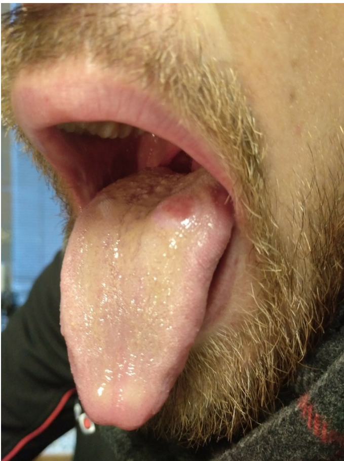
Figura 1. Imagen inicial de la lesión en la parte posterior izquierda de la lengua. Nódulo infiltrante de aspecto limpio y bordes definidos