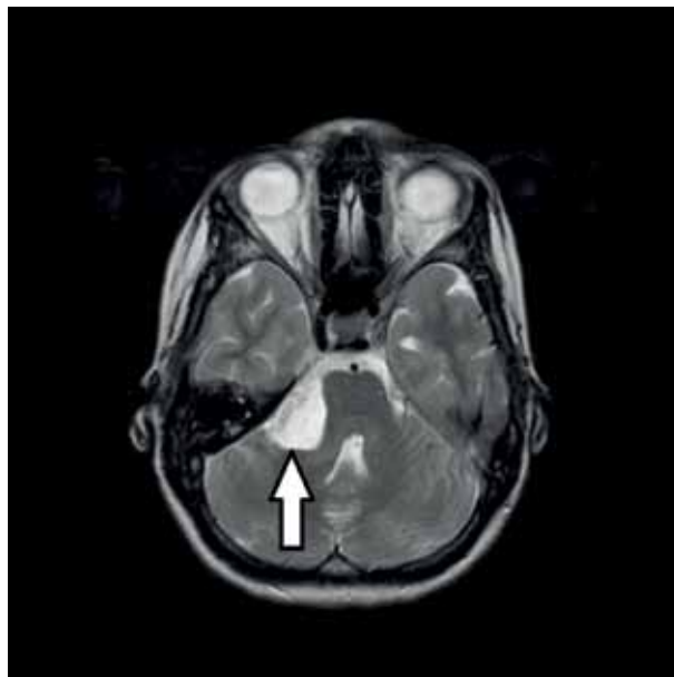
Figura 2. RNM craneal. La flecha indica lesión compatible con quiste epidermoide en ángulo pontocerebeloso derecho

Bajo el diagnóstico de parálisis facial periférica, iniciamos tratamiento con dosis de corticoides vía oral (1 mg/kg/día), masaje facial y protección ocular, presentando una ligera mejoría en los 4 primeros días. Posteriormente evolucionó hacia un empeoramiento de su sintomatología, siendo la exploración neurológica en todo momento similar a la del diagnóstico del caso, motivo por el cual tras 2 semanas de tratamiento se decidió valoración con carácter preferente por el servicio de Otorrinolaringología (ORL).