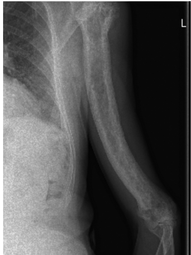
Figura 2. Hiperostosis del húmero izquierdo con refuerzo de la cortical e imágenes osteolíticas a lo largo de toda la diáfisis humeral.

Se envía al servicio de Reumatología, donde se realiza estudio de extensión mediante gammagrafía, sin hallarse afectación de otras áreas, por lo que se diagnostica definitivamente de enfermedad de Paget monostótica, no considerándose necesario tratamiento médico alguno.